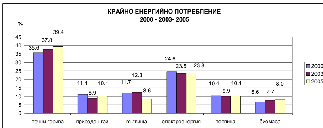
Фигура 2.4: Крайно енергийно потребление в периода 2000-2005 година.

Нарастващата употреба на течни горива и на дървесина за огрев, трябва да бъдат взети под внимание при определянето на приоритетните мерки по енергийна ефективност.