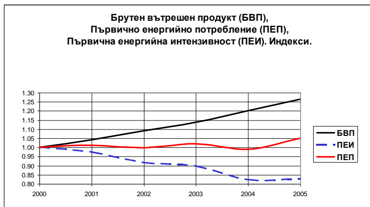
Фигура 2.3: Първична енергийна интензивност 5 – историческо развитие

Започналият процес на нарастване на потреблението на енергия в страната се обяснява с: