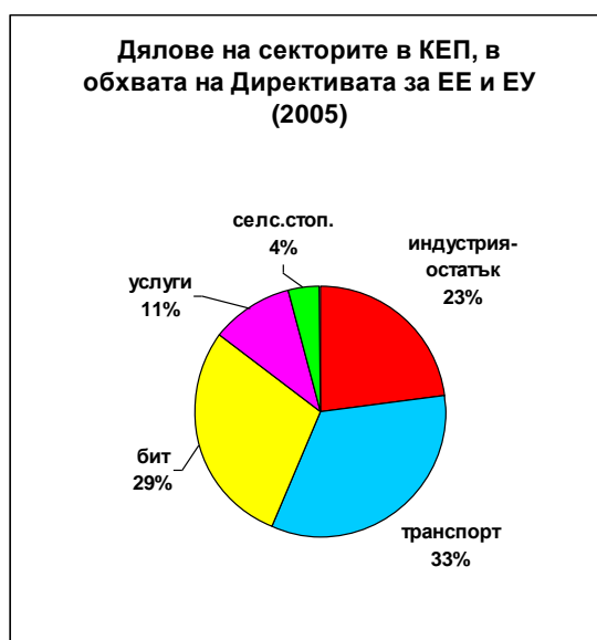
Фигура 2.5: Структура на крайното енергийно потребление в обхвата на Директивата (разпределение по сектори)

На фигура 2.5. е показано потреблението по сектори за 2005 година. За разлика от разпределението на общото крайно енергийно потребление, в което най-голям консуматор е индустрията (39%), тук в крайното енергийно потребление, в обхвата на Директивата, се вижда, че 62% от енергийното потребление е съсредоточено в секторите „Транспорт” и „Домакинства” .